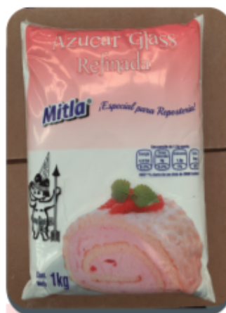
Azúcar Glass Caja 20/1Kg.