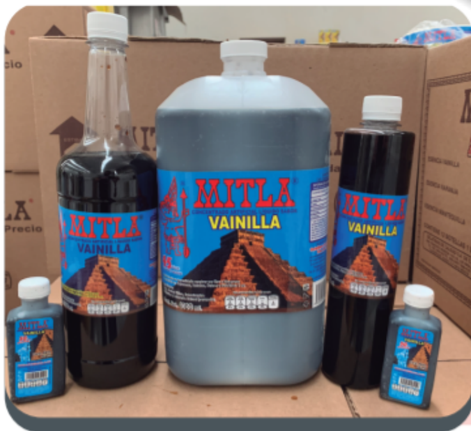
Concentrado de Vainilla