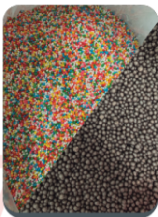
Gragea Dulce para panificación (multicolor y chocolate)