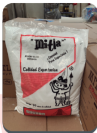
Azúcar Glass Bolsa 5 Kg