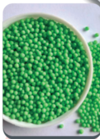
Gragea ácida para Dulceros